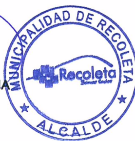
DANIEL JADUE JADUE ALCALDE